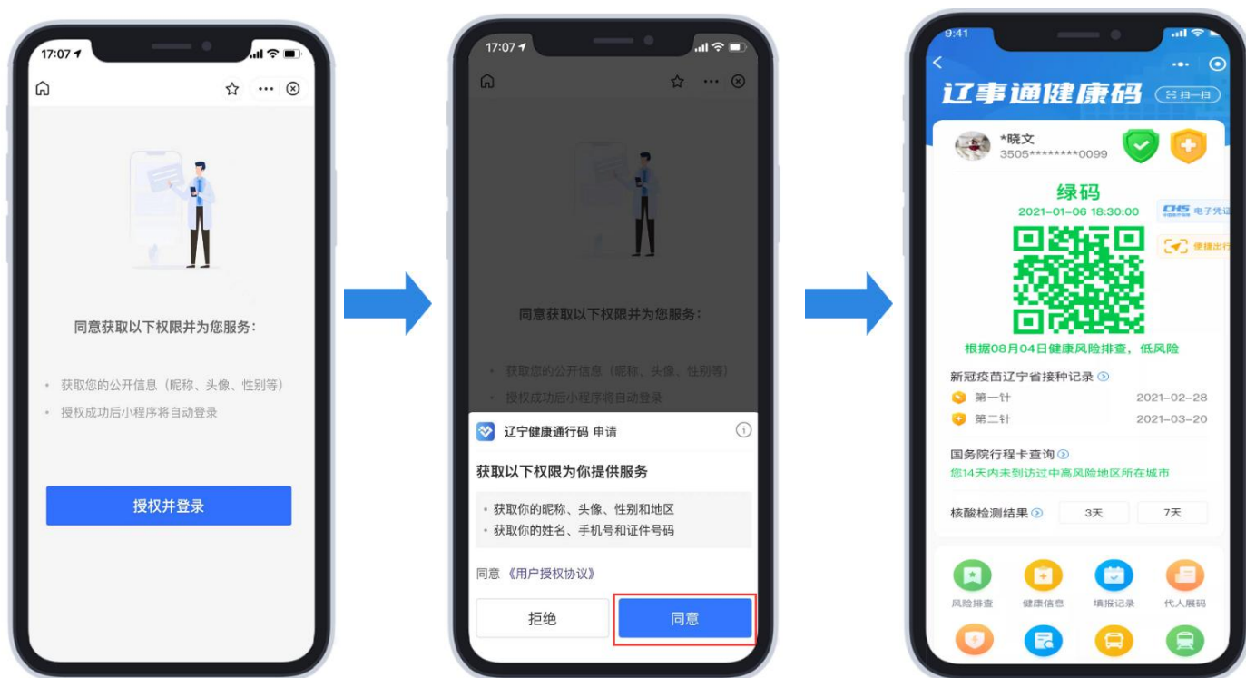
(1)扫码后进入授权登录