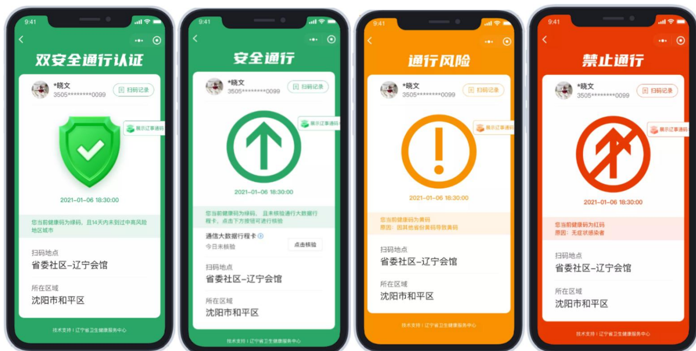
双安全认证通行 (绿码+行程卡)